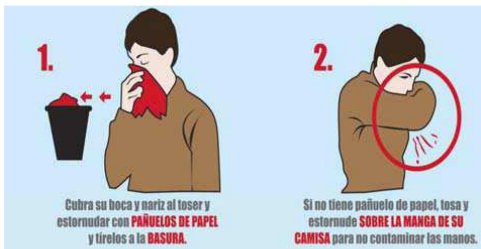
Figura 2.- Método de higiene respiratoria